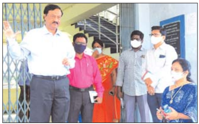
విద్యార్థులతో మాట్లాడుతున్న వీసీ