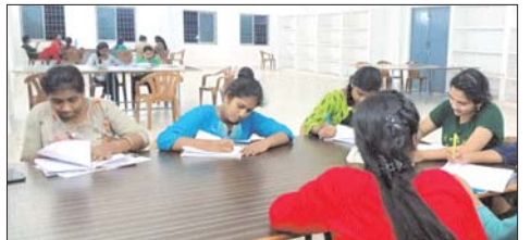
ఉమెన్స్ హాస్టల్ టీవీ రూమ్, స్టడీ రూమ్