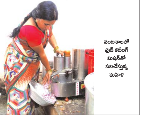
వంటశాలలో ఫుడ్ కటింగ్ మిషన్ తో పనిచేస్తున్న మహిళ