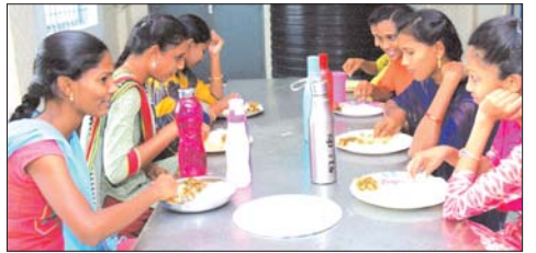
మెన్ లో భోజనం చేస్తున్న విద్యార్థులు