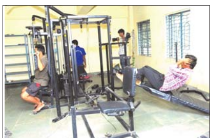
జిమ్ వ్యాయామంలో విద్యార్థులు

ఉభయగోదావరి జిల్లాలలో పాటు ఇతర రాష్ట్రాల నుండి ఆదికవి నన్నయ విశ్వవిద్యాలయ ప్రాంగణంలో విద్యాభ్యాసం నిమిత్తం వచ్చిన విద్యార్థిని విద్యార్థులకు చక్కని వసతి గృహాలు ఉన్నాయి. ఆహ్లాదకరమైన వాతావరణంలో జిమ్, స్టడీ రూమ్స్, సీసీ కెమేరాల పర్యవేక్షణలో హాస్టల్స్ నడపబడుతున్నాయి. స్టూడెంట్ మేనేజ్మెంట్ హాస్టల్ గా విద్యార్థులచే మెన్ నడుస్తుంది. మెన్ కమిటీ, స్పోర్ట్ కమిటీ, టేస్టింగ్ కమిటీ, ఫ్లోర్ కమిటీ వంటి వాటితో విద్యార్థులే హాస్టల్స్ ను నిర్వహిస్తుంటారు. వీరికి పైన విశ్వవిద్యాలయ సహాయాచార్యులు నివాస సంరక్షకులుగా వారికి పైన చీఫ్ వార్డెన్స్ పర్యవేక్షిస్తుంటారు. విద్య, వినోదం, ఆటలు, పాటలతో కొత్త స్నేహితులతో అందంగా, ఆనందంగా ఉండే ఈ హాస్టల్స్ యూనివర్సిటీకి ప్రత్యేకతగా చెప్పవచ్చు.