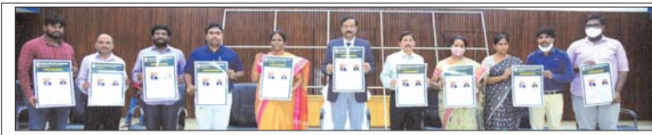
ఆంగ్లో సోఫీ క్లబ్ను ప్రారంభించి, బ్రోచర్ ఆవిష్కరించిన ప్రారంభించిన వీసీ