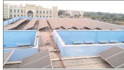
ఉమెన్స్ హాస్టల్ పైన సోలార్ పవర్