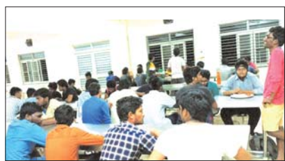
మెన్ లో భోజనం చేస్తున్న విద్యార్థులు