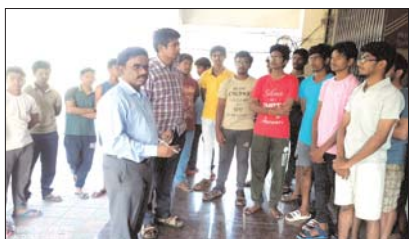
హాస్టల్ ను పరిశీలించిన రజిస్ట్రార్